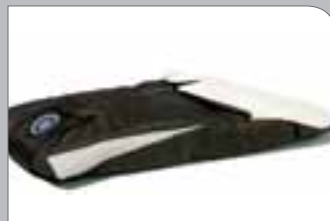
Thermo Fußsack Klima Zone