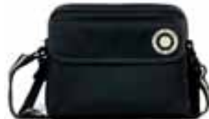
Maße: 27,5 x 13 x 23,5 cm