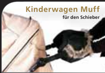
Kinderwagen Muff für den Schieber