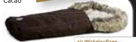
Fußsack Sehr hoher Kälteschutz durch gefütterten 600D Stoff in Verbindung mit Thermovlies