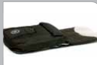
Duo Fußsack All-Season