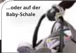
...oder auf der Baby-Schale