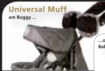
Universal Muff am Buggy ...