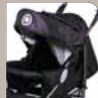
Black (nur Eagle S)