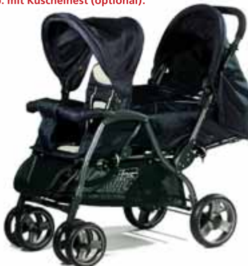
Abb. mit Kuschelnest (optional).