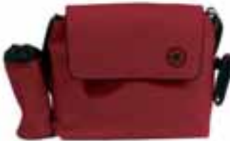
Maße: 55 x 13,5 x 33 cm (mit Handy- und Gefäßtasche) 42 x 13,5 x 33 cm (ohne Handy- und Gefäßtasche)