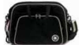
Maße: 43 x 15 x 32 cm